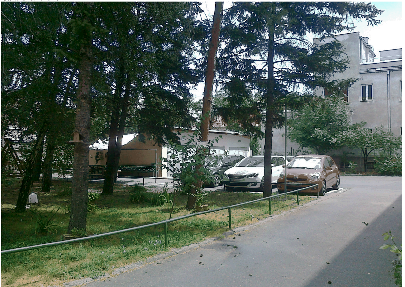
Vnútroblok ul. R Peregrína a ul. Čs. armády 6.7.2016